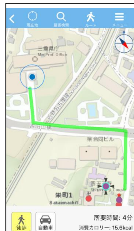
図2 G-motty Mobile