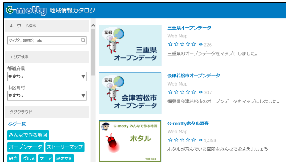
図1 G-motty地域情報カタログサイト

ESRIジャパン(株)が提供する、地域情報を知る・探すためのアプリケーション『G-motty地域情報カタログサイト』（図1）及びスマートフォンアプリ『G-motty Mobile』（図2）において、県の提供する「文化資産等」、「句碑」のデータが活用されています。